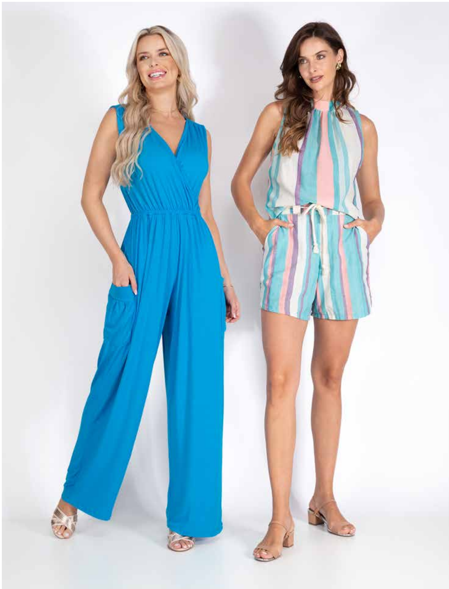
62148 Macacão - Malha Viscolykra 02 Preto - 07 Azul - 15 Verde - 67 Vermelho 85 Amarelo - 8976 Lilás