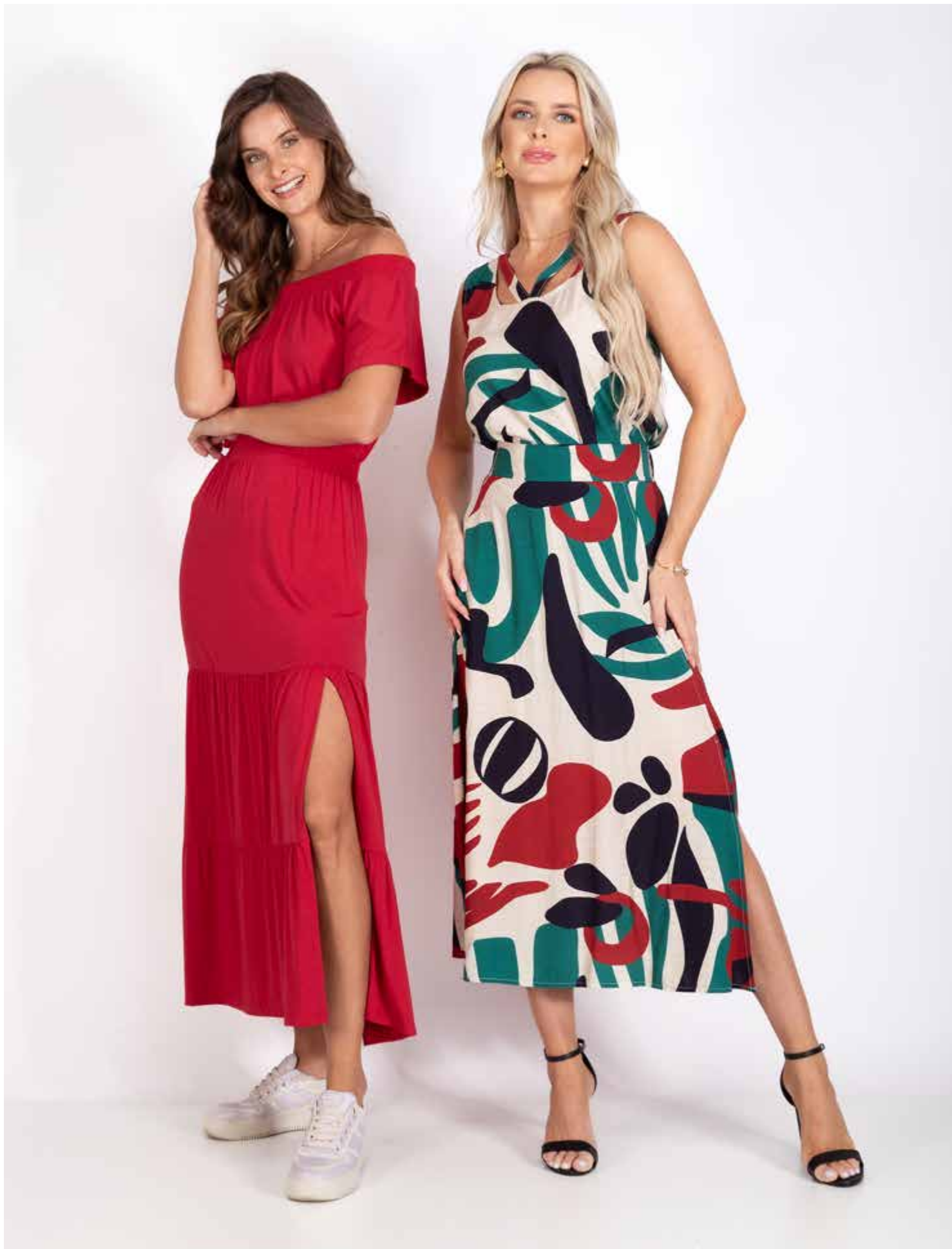
62507 Vestido - Malha Viscolycra 02 Preto - 07 Azul - 15 Verde - 67 Vermelho 85 Amarelo - 8976 Lilás