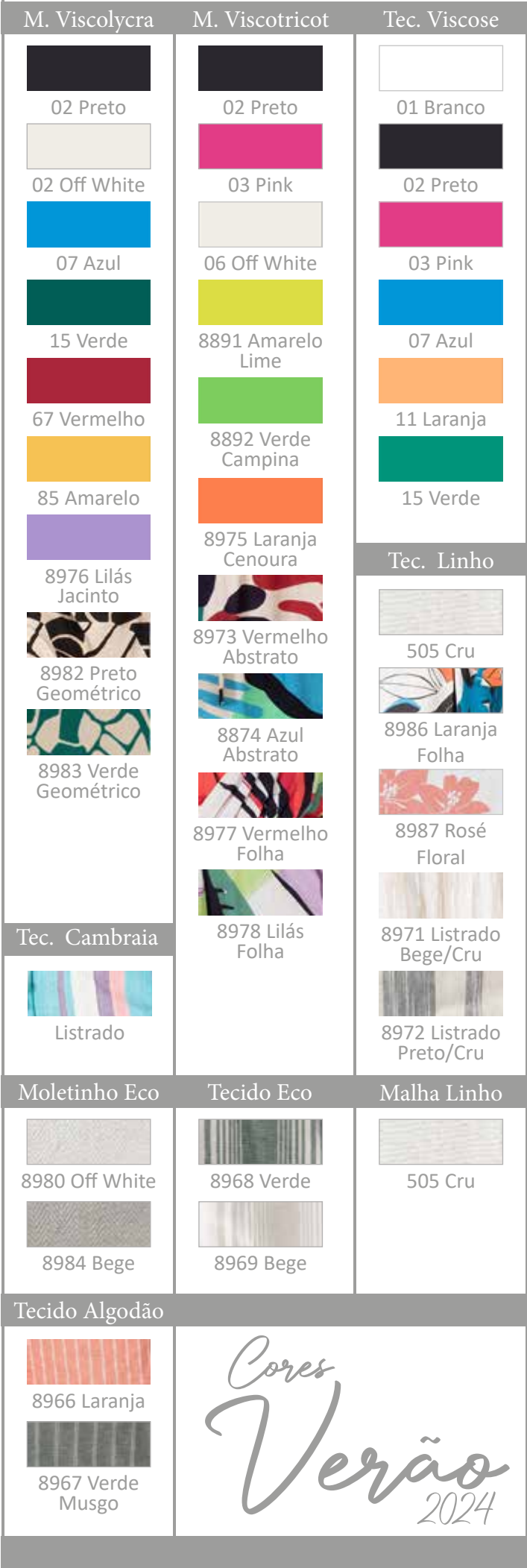
62135 Vestido - Tecido Eco 505 Cru Linho Liso - 8968 - Verde Listrado - 8969 Bege Listrado