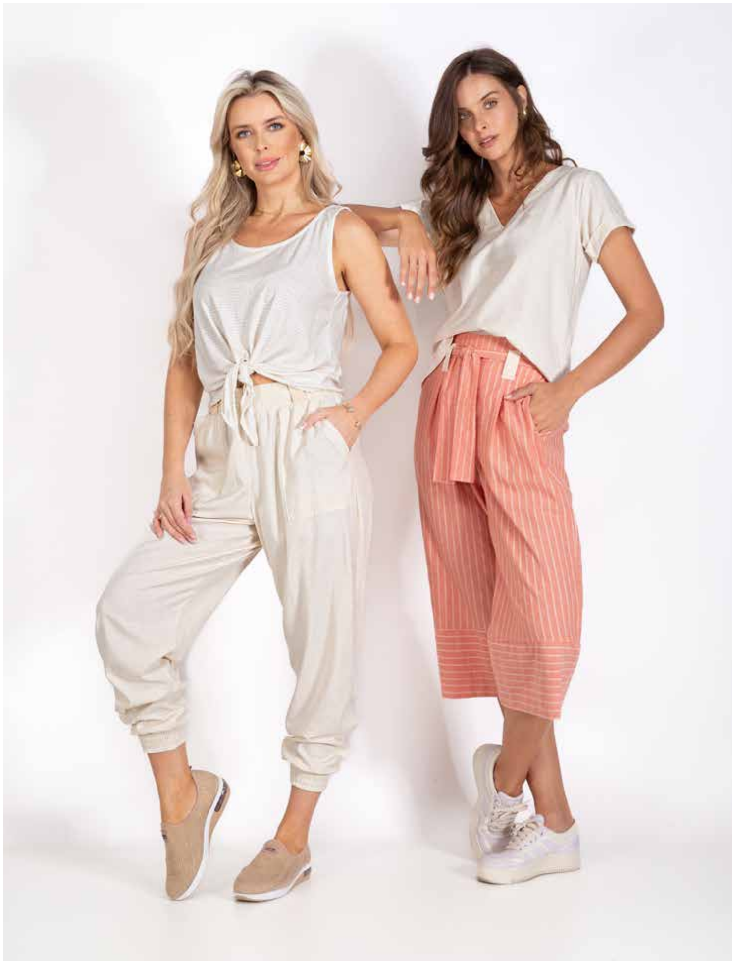
62197 Blusa - Malha Canelada Linho 505 Cru