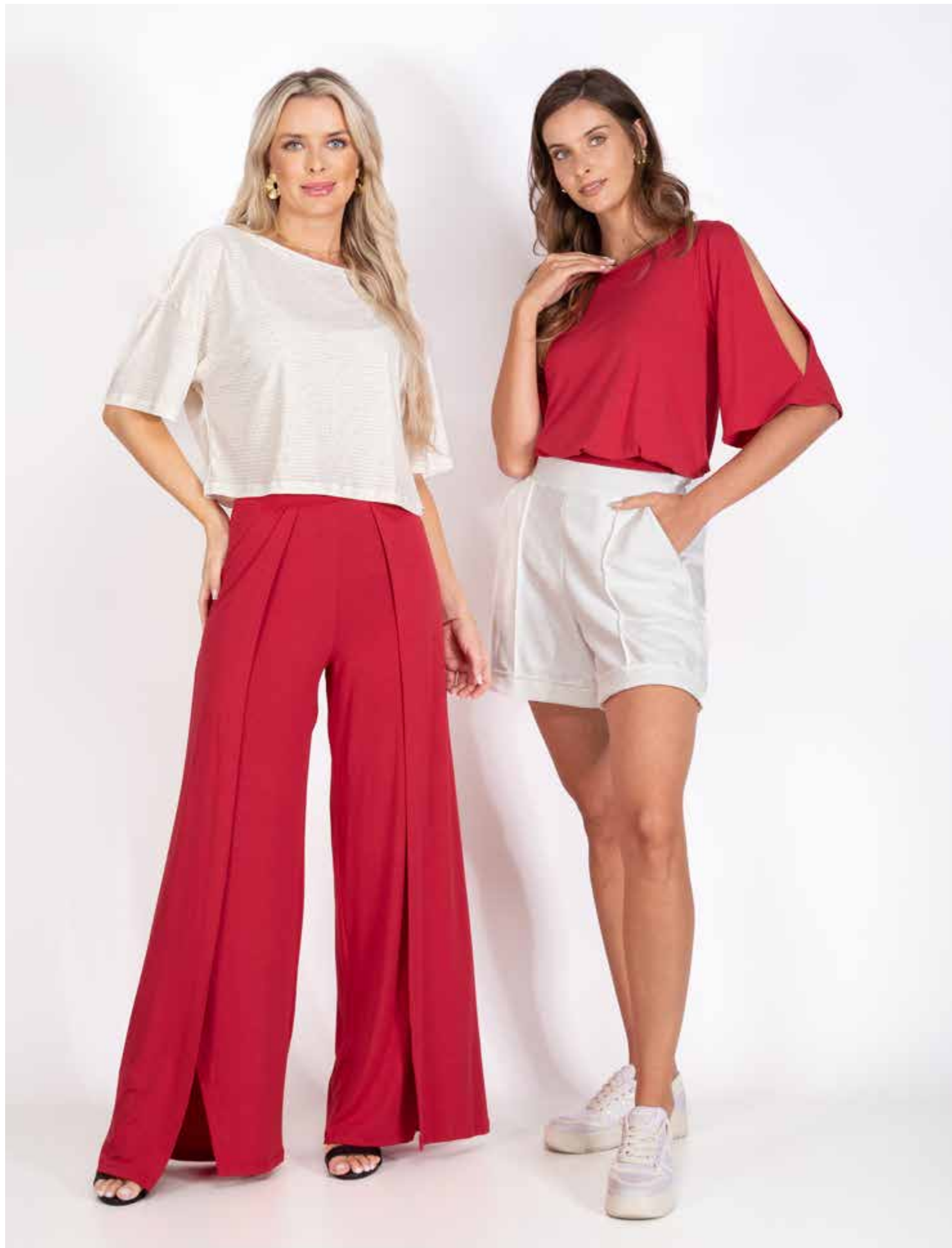
62199 Blusa - Malha Canelada Linho 505 Cru