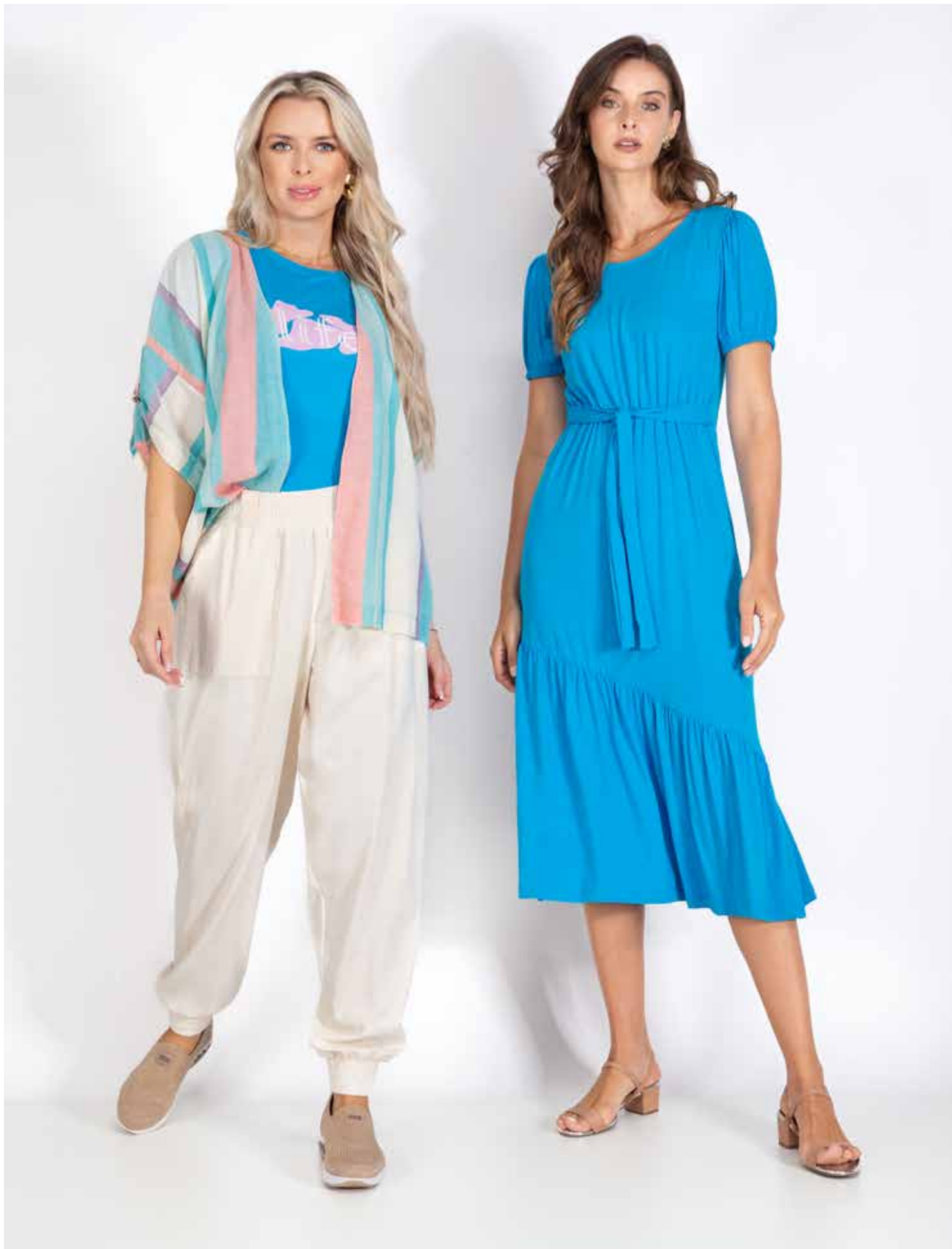
62116 Kimono - Tecido Cambraia de Algodão 8970 Listrado